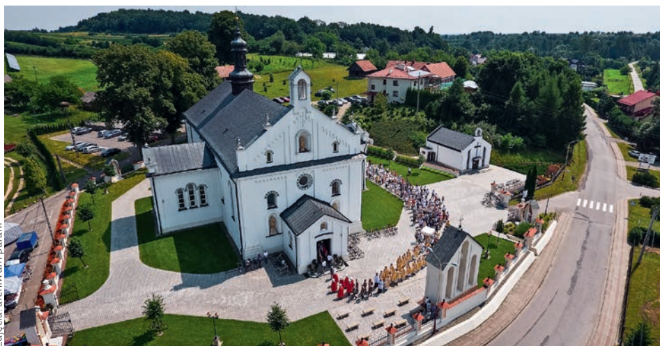
Kościół parafialny św. Barbary w Grodzisku Dolnym

Relacja z przyjęcia relikwii dostępna jest na stronie parafii: parafiagrodziskodolne.pl