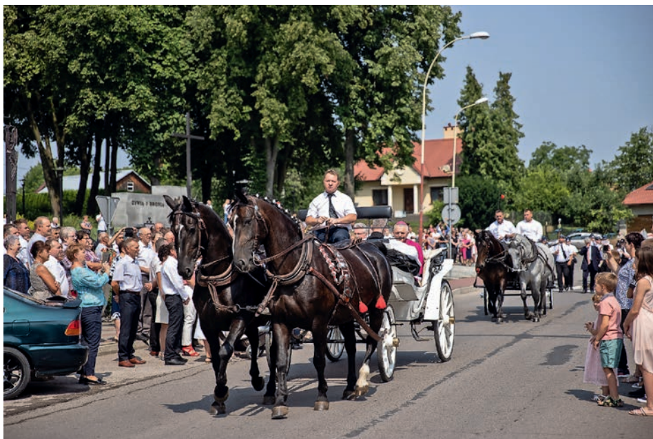
Relikwiarz przewieziono do parafii bryczką